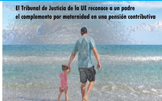
El Tribunal de Justicia de la UE reconoce a un padre el complemento por maternidad en una pensión contributiva

En aquellos supuestos en que la pensión inicialmente causada no alcance la cuantía mínima de pensiones que anualmente establezca la correspondiente Ley de Presupuestos Generales del Estado, se reconocerá dicha cuantía, teniendo en cuenta las previsiones establecidas en relación a los complementos para pensiones inferiores a la mínima. A este importe se sumará el complemento por hijo, que será el resultado de aplicar el porcentaje que corresponda a la pensión inicialmente calculada.